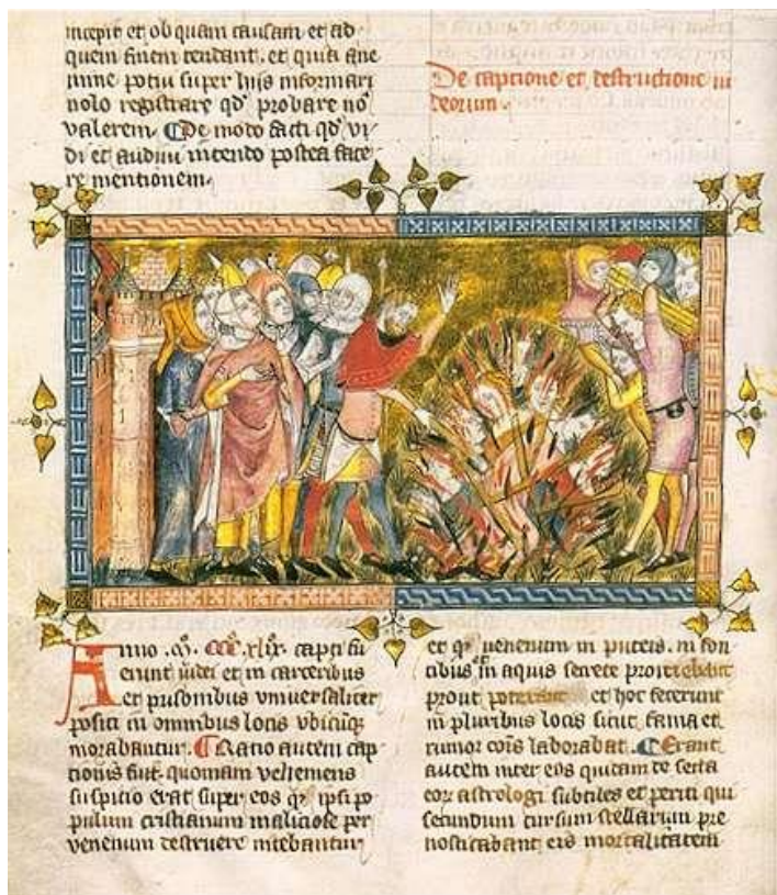
A sinistra: Uccisione di Ebrei ritenuti responsabili della peste, illustrazione in una cronaca del XIV secolo, Biblioth que Royale de Belgique

La spiegazione medica , che segue la tradizione ippocratico-galenica , pur non escludendo la volontà divina come causa ultima, addebita la peste alla "corruzione dell'aere" , all'aria putrida e corrotta che corrompe, rompe l'equilibrio degli umori del corpo, ed è magari propiziata da comete o eclissi, o dalla particolare congiunzione di Saturno, Marte e Giove nel segno dell'Acquario. Scrivono i medici dell'Università di Parigi: "Una congiunzione astrale, insieme ad altre congiunzioni ed eclissi, è causa reale della gravemente mortifera corruzione dell'aria che ci circonda, fonte di mortalità e di carestia [...] Noi crediamo che la presente epidemia provenga direttamente dall'aria corrotta ..."